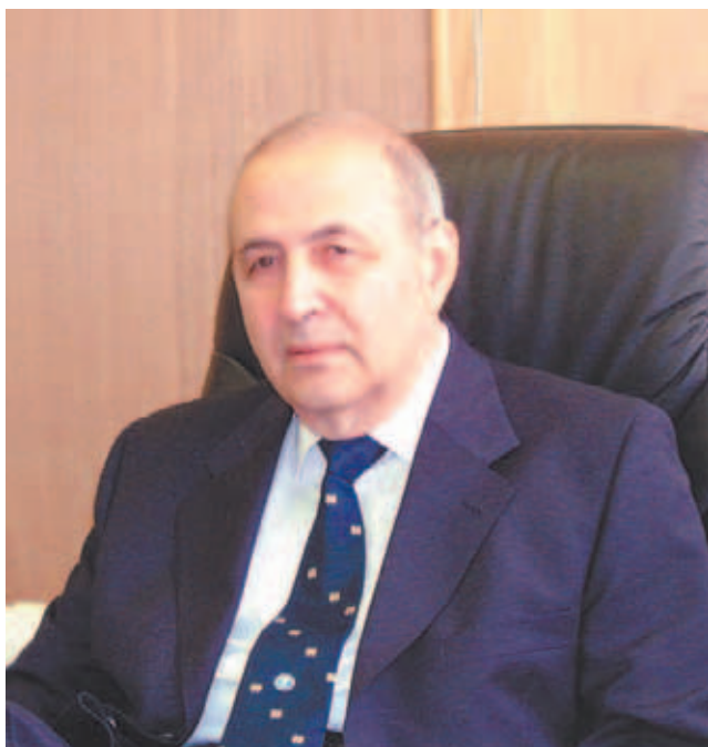
Основатель и первый директор ИСМАНа академик Александр Григорьевич Мержанов