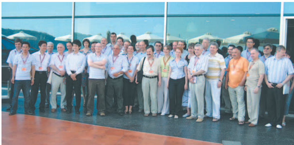
Участники X Международного симпозиума EPNM-2010